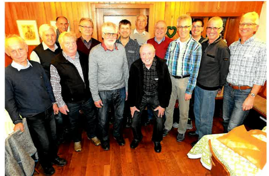
... beim Jahresessen der Altkleidersammler („Lumpi-Essen“)