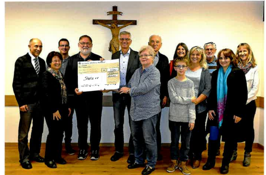
... bei der Scheckübergabe des Erlöses des Bücherflohmarktes