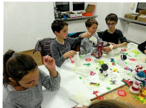
Basteln bei der Adventfeier