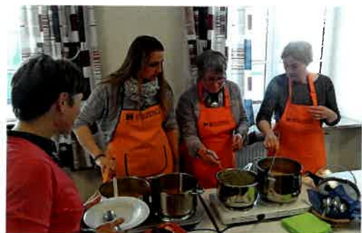
Fastenessen im „neuen“ Pfarrheim