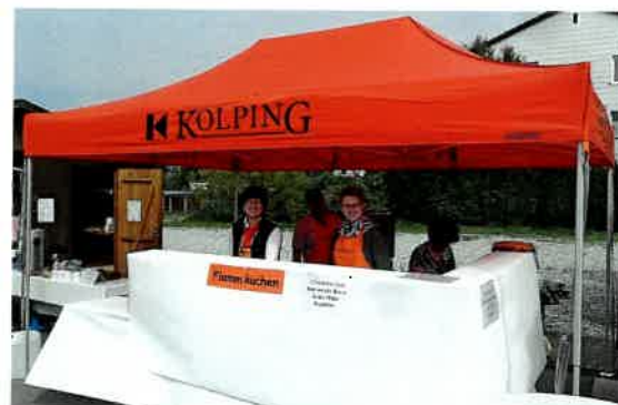
Unser neuer Pavillon beim Pfarrfest