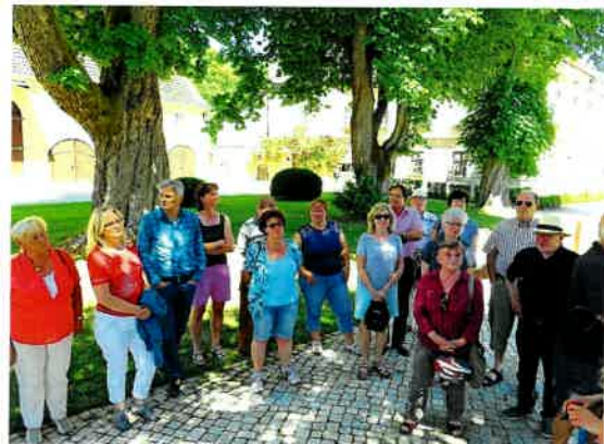
Besichtigung Prälatenstock in Raitenhaslach